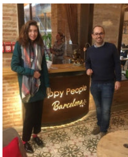
Stage en Espagne ou en Irlande dans le cadre du programme Erasmus +

Stage à l'étranger dans le cadre du programme européen Erasmus + : les élèves effectuent un stage de 4 semaines à l'étranger au cours duquel ils développent leurs compétences, savoir-faire et leur autonomie. Ils sont accompagnés par un référent sur place.